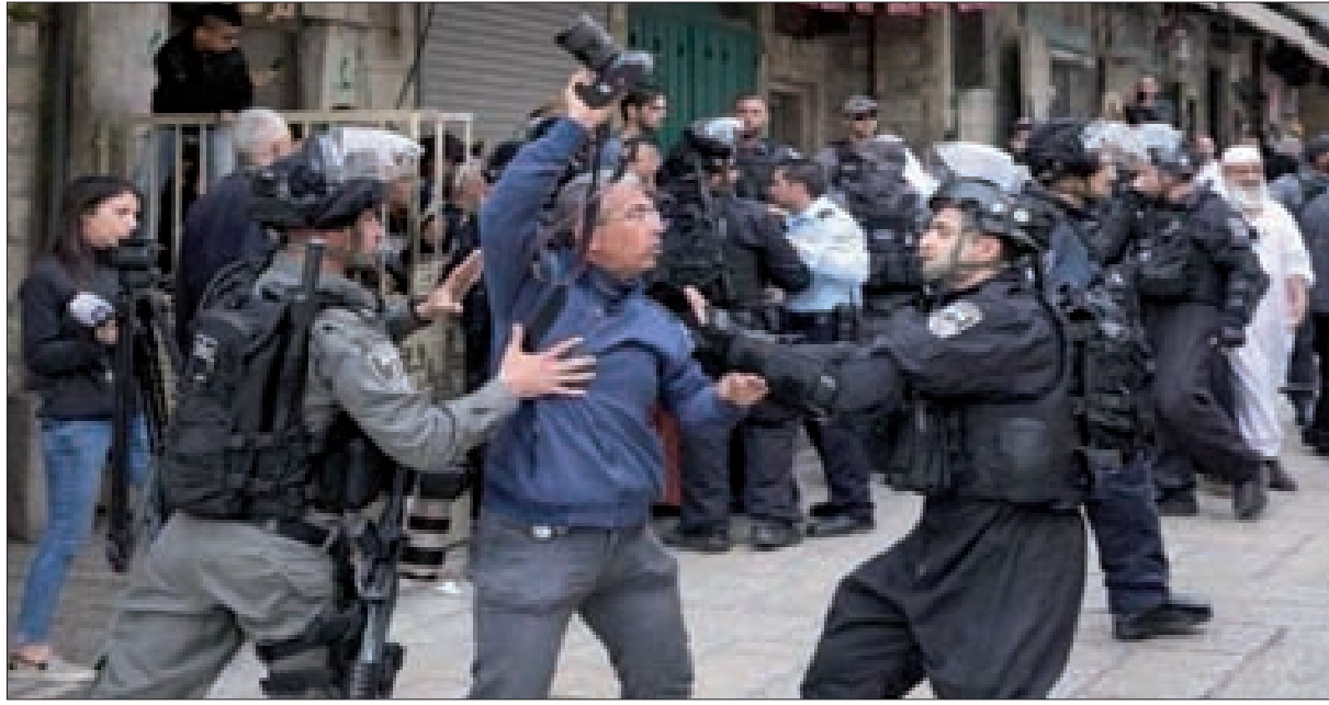
مواجهات حادة بين قوات الاحتلال وصحافيين فلسطينيين في القدس أمس